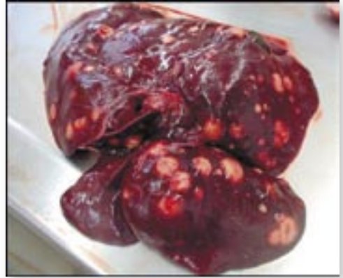
Abbildung 2: Typisches Bild der Leber eines Berner Sennenhundes mit disseminiertem histiozytären Sarkom mit zahlreichen unterschiedlich großen, hellen Tumorinfiltraten.

Dagegen zeigt die systemische Histiozytose , die vor allem bei jungen bis mittelalten Berner Sennenhunden auftritt, einen lang-