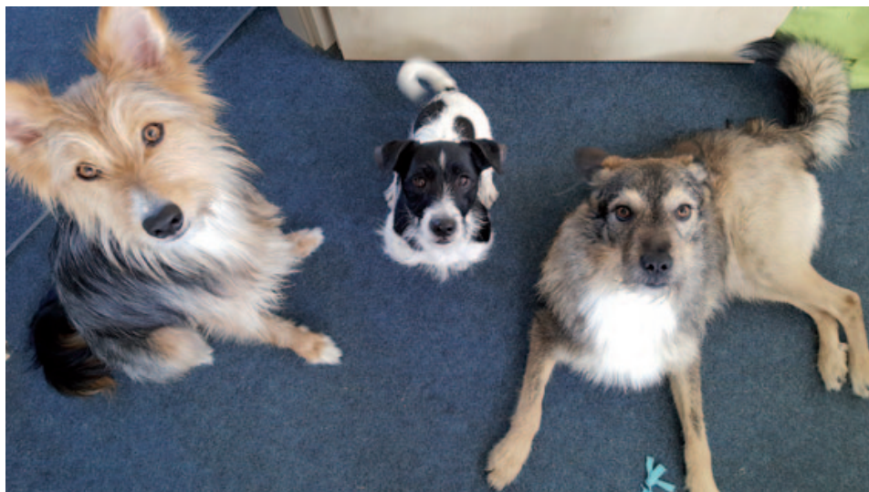
Die vierbeinigen Koforscher Diego, Mogli, und Lolek.

weil sich die grundsätzliche Funktion der Hundevibrisse auch durch die Untersuchung von wenigen Einzeltieren belegen lässt.