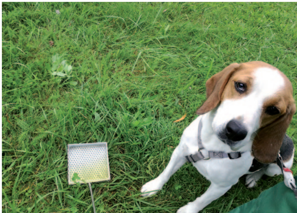
Testesserin bei der Urinabgabe. Der Harn der Hündin befindet sich in dem Auffangbehälter mit Stiel im Gras.

Zu den unlöslichen, unfermentierbaren bzw. schlecht fermentierbaren Fasern zählen beispielsweise Zellulose und Lignin. Studien zeigen, dass unfermentierbare Fasern die Kotqualität verbessern und den Gehalt an möglicherweise krebserregenden Stoffen im Kot senken können.